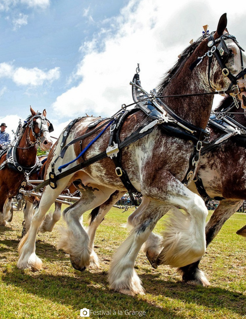
Festival à la Grange