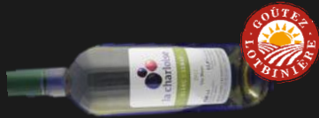
Blanc de Lemay Médaille d'or FLIWC 2016

Arôme intense de fruits (ananas et pomme) avec des notes florales (fleur d'oranger). Bouche: bien équilibré, frais et puissant. Fini acide très agréable et persistant.