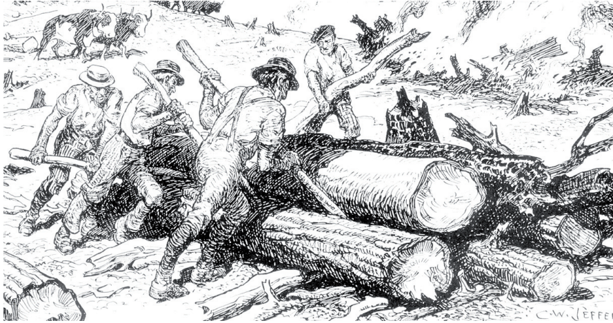
Scène évoquant l'abattage d'arbres pour faire place au Chemin Craig Source: Clearing the land (C. W. Jefferys), Kinnear's Mills , page 24.

Lorsqu'on circule dans notre région à travers le paysage sinueux et bucolique de nos montagnes, surtout celles en couleurs ces temps-ci, on peut remarquer des vestiges du passé entourant l'histoire et le patrimoine des chemins Craig et Gosford.